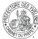
N° A11 Jean-Jacques BROT