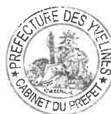
N° A11 Jean-Jacques BROT